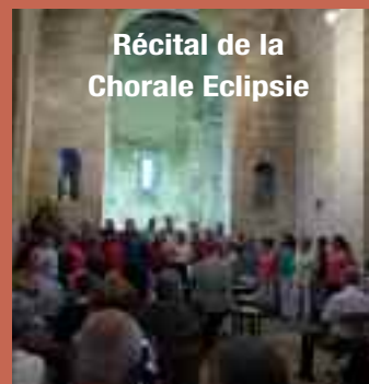
Récital de la Chorale Eclipsie