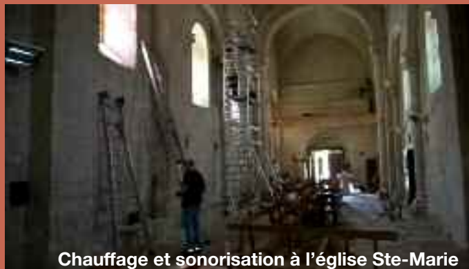
Chauffage et sonorisation à l'église Ste-Marie