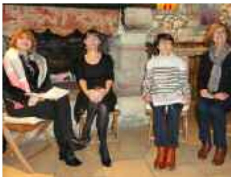
Procession dans les rues d'Aubiac et soirée contée au château à l'occasion de la fête des lumières