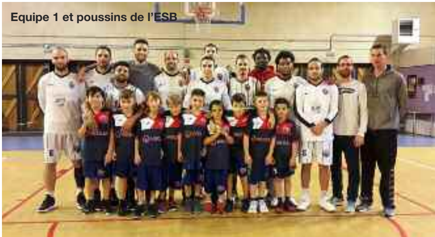
Equipe 1 et poussins de l'ESB