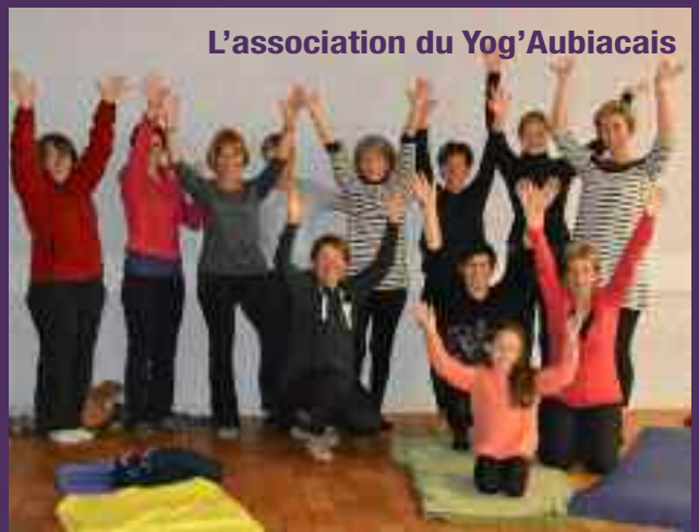
L'association du Yog'Aubiacaïs