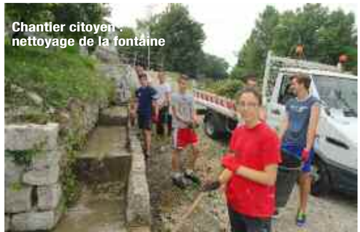
Chantier citoyen : nettoyage de la fontaine

La semaine s'est clôturée par la distribution d'une « attestation de service fait » et d'une bourse de 76 euros à chaque participant. Une auberge espagnole dans la salle Hector Bigué a clôturé cette excellente semaine.