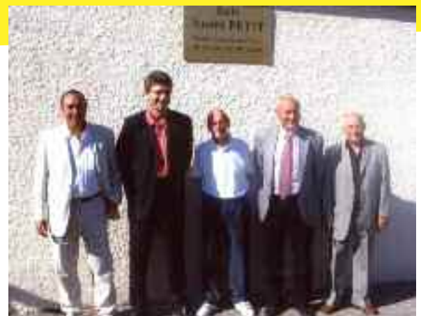
Inauguration de la salle des sports