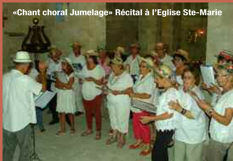
«Chant choral Jumelage» Récital à l'Eglise Ste-Marie