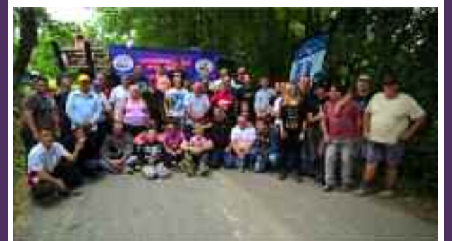
Descente des caisses à savon route du Baqué