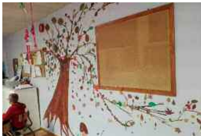
Décoration des murs de la garderie par les enfants dans le cadre du périscolaire

1 er adjoint au maire en charge des affaires scolaires