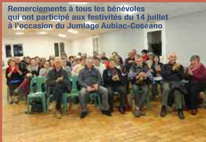
Remerciements à tous les bénévoles qui ont participé aux festivités du 14 juillet à l'occasion du Jumlage Aubiac-Coseano