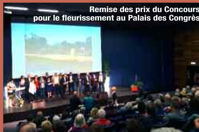
Remise des prix du Concours pour le fleurissement au Palais des Congrès