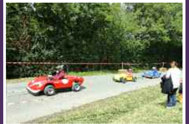
Descente des caisses à savon route du Baqué