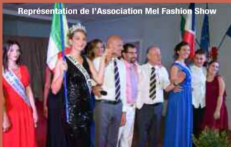
Représentation de l'Association Mel Fashion Show