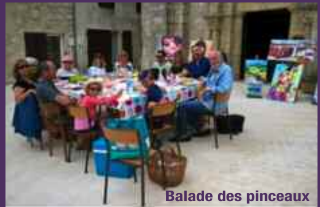
Balade des pinceaux