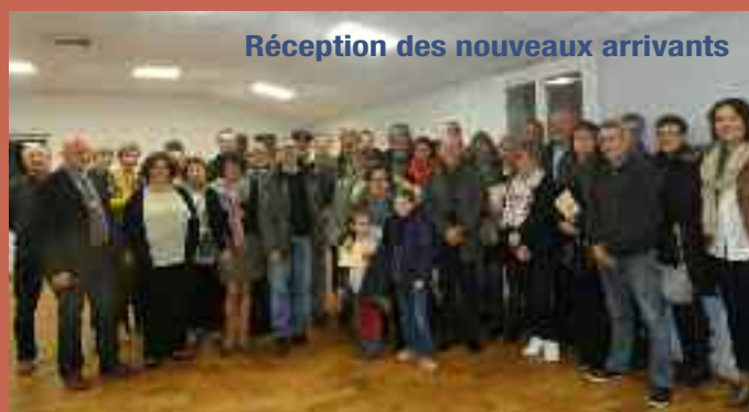
Réception des nouveaux arrivants