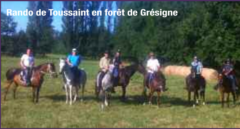
Rando de Toussaint en forêt de Grésigne