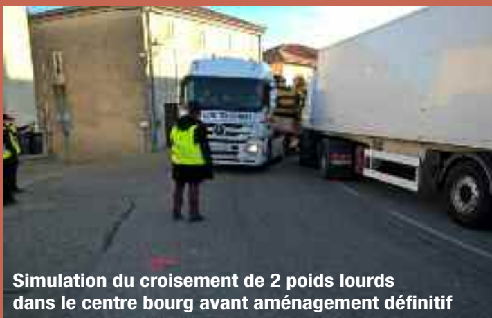
Simulation du croisement de 2 poids lourds dans le centre bourg avant aménagement définitif